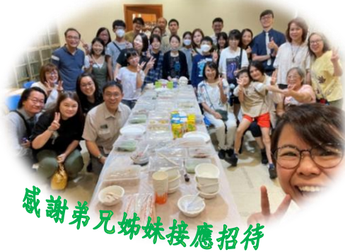
感謝弟兄姊妹接應招待